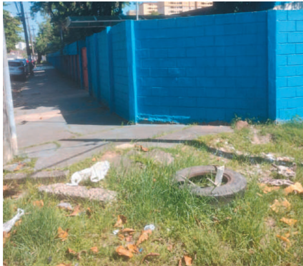
Problemas em diversos pontos são sanados todos os dias; em alguns, o trabalho precisa ser feito pela recorrência do descarte

Pais de alunos de uma escola de ensino infantil que fica ao lado do local estão sempre preocupa-