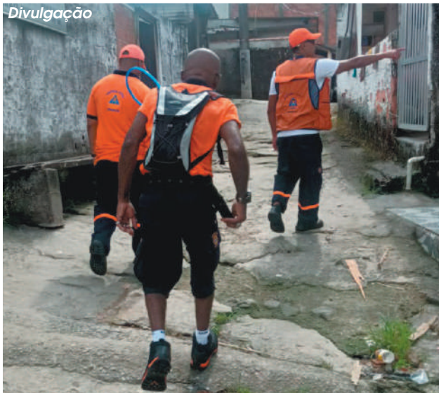
Devido os alertas de chuvas intensas, agentes estiveram nesta quinta-feira (21), em vários morros da Cidade

A Defesa Civil de Guarujá emitiu o alerta de previsão de pancadas de chuva e condições para temporais, seguidos por raios e intensas rajadas de vento para toda a região, entre quinta-feira (21) e domingo (24). O acumulado previsto é de 180 milímetros neste período. Por prevenção, as equipes estão vistoriando as áreas de risco e orientando os moradores.