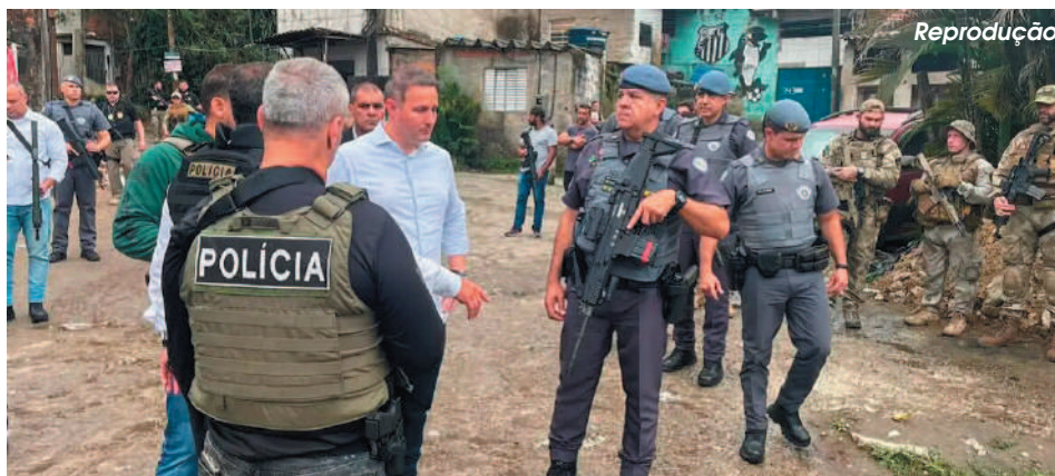
Levantamento revelou que as operações tiveram baixa eficiência, alta letalidade policial e aumento de crimes

Um dos destaques na dinâmica criminal na região classificada pela SSP como Deinter O6 - que abrange Baixada Santista e parte do Vale do Ribeira - foi o aumento em 71% das tentativas de homicídios durante os meses da operação em 2023, agos-