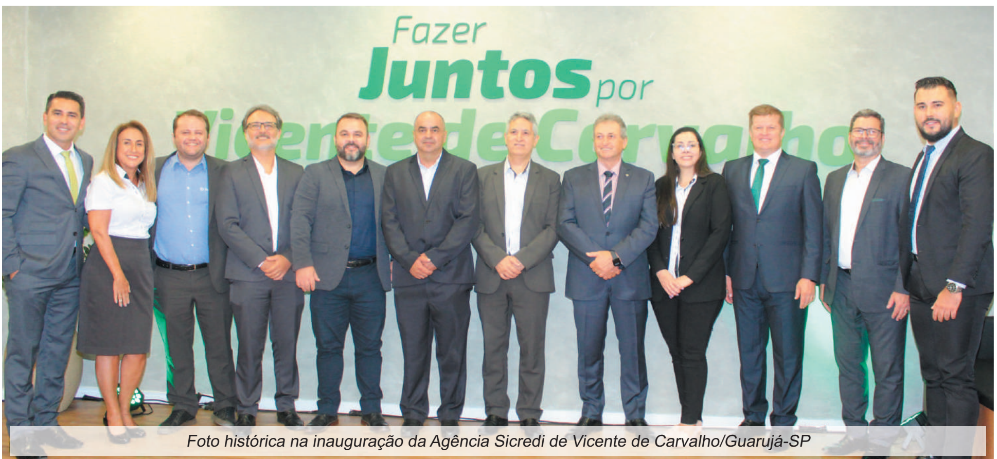
Foto histórica na inauguração da Agência Sicredi de Vicente de Carvalho/Guarujá-SP