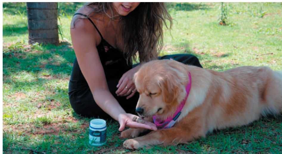
Alimentos, plantas e produtos utilizados no dia a dia podem ser tóxicos para os animais

sultar o médico-veterinário. Se o pet já faz uso de alimentação natural, o tutor já sabe como preparar as refeições e pode variar os ingredientes conforme as orientações do veterinário. Se o pet se alimenta de ração, é preciso verificar como fazer o mix feeding (combinação de alimentos secos com úmidos) sem afetar a quantidade de calorias a serem ingeridas, sempre considerando as demais condições de saúde do animal: se não possui alergias, gastrite, diabetes ou outras doenças que requerem ainda maior cuidado”, alerta Farah.