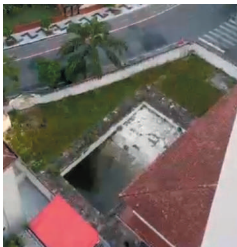
Nas Astúrias, piscina abandonada preocupa moradores, já na Enseada, problema são os pontos de descarte irregular de lixo