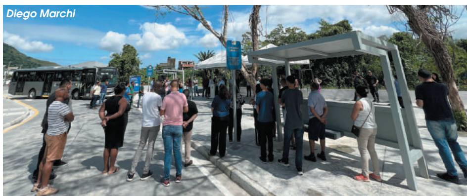
Equipamento tem capacidade para 15 ônibus e 10 linhas diferentes

Durante a cerimônia também foram entregues seis ônibus, sendo quatro convencionais, dois 100% elétricos e uma van adaptada para pessoas com mobilidade reduzida. A frota, uma das mais modernas da Baixada Santista, conta com 173 ônibus, que transportam diariamente 80 mil passageiros. São 110 ônibus convencionais, 43 midiônibus, três executivos, cinco articulados, um superarticulado, um microônibus, seis elétricos e quatro vans adaptadas.