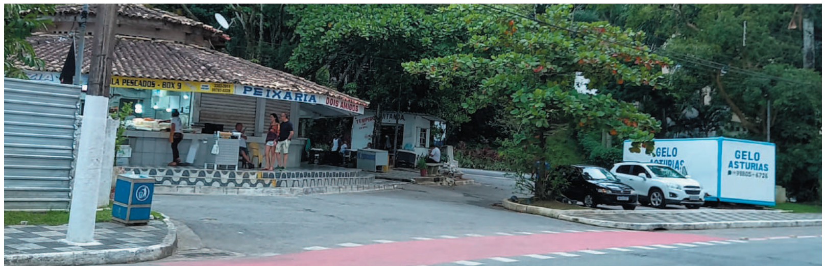
Comerciantes convivem com a perspectiva de obra que visa a construção de novas instalações no local; cercado há 14 meses, área apresenta sinais de desgaste e deprecação, e placa da obra foi retirada do local

Para eles há ainda a incerteza sobre a permanência no local quando as novas instalações