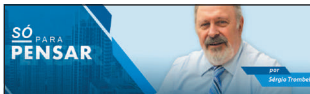
por Sérgio Trombelli

Guarujá conta com uma frota de transporte público moderna, que dispõe de ônibus com ar-condicionado, wi-fi, entradas USB e acessibilidade. A frota conta com 173 ônibus, que transportam diariamente 80 mil passageiros. São 110 ônibus convencionais, 43 midiônibus, três executivos, cinco articulados, um super-articulado, um microônibus, seis elétricos e quatro vans adaptadas.